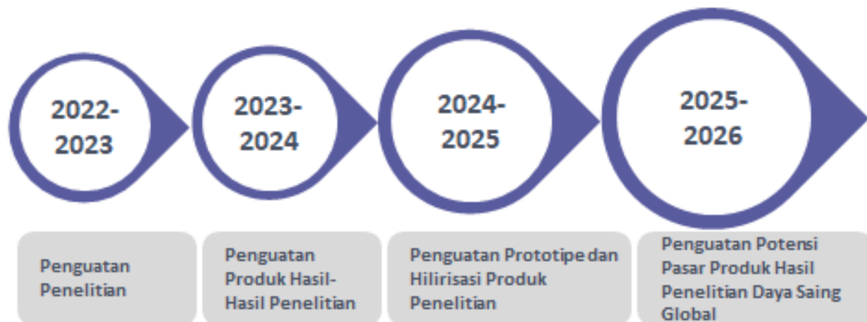
Gambar 1. Tahapan Perkembangan Penelitian Universitas Pendidikan Nasional 2022 – 2026

Dalam rangka mendukung visi, misi tujuan dan sasaran, pada tahun 2022 – 2026 LP2M Universitas Pendidikan Nasional telah menetapkan Agenda Riset dan Pengembangan IPTEKS Universitas Pendidikan Nasional. Pengembangan program penelitian dan pengembangan IPTEKS di lingkungan Universitas Pendidikan Nasional diformulasikan ke dalam payung besar penelitian dan pengembangan IPTEKS Universitas Pendidikan Nasional yaitu “Pengembangan dan Penerapan Teknologi dan Ekonomi Kreatif Berbasis Tri Hita Karana yang Berkelanjutan” . Untuk mencapai kesejahteraan berkelanjutan tersebut, Agenda Riset dan Pengembangan IPTEKS Universitas Pendidikan Nasional ditetapkan sebagai berikut: